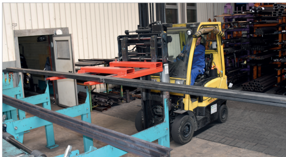
Prise de charges longues