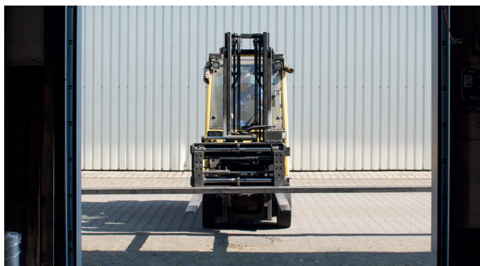
Le passage de portail avec du matériel de grande longueur n'est pas possible sans le LSL