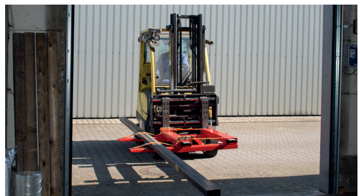
Passage de portails simplifié avec de grandes longueurs, d'allées grâce au type LSL