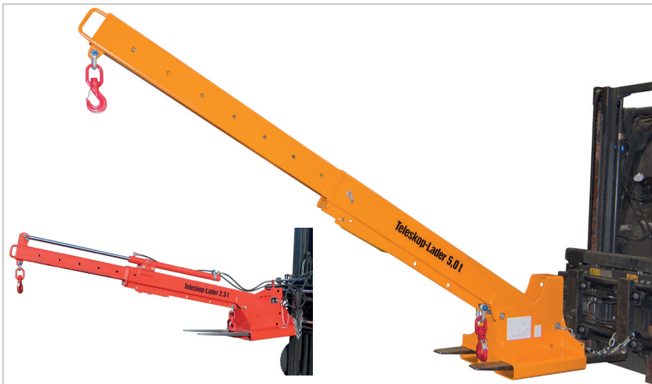
KT hydraulisch teleskopiert (Zubehör)