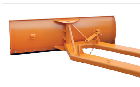
SCH-G réglé à droite