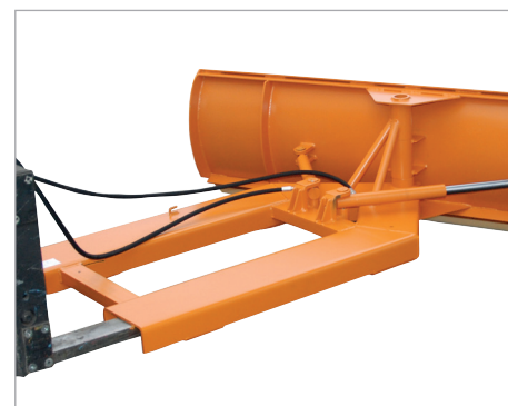
Réglage hydraulique du bouclier