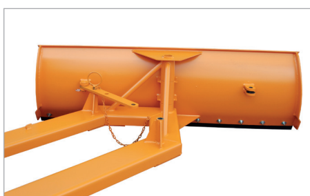
SCH-G réglé à gauche