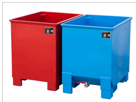
C 30 et CS 30