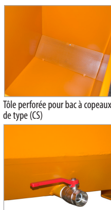
Tôle perforée pour bac à copeaux de type (CS)