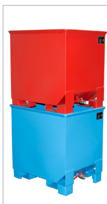
CS 30 superposables