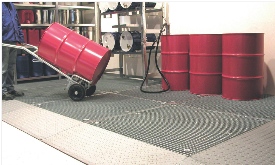
8 x BSW + 6 x AR + 1 x AE + 3 x KV + 10 x WV (options: diable à fûts FP-V, rayonnages à fûts FR)