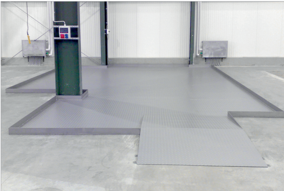
Bodembeschermbekledingen met uitsparing voor pijlers en overrijdplaten

Volgens Duitse richtlijnen "VAWS" en "WHG" moeten transferpunten en be- en ontlaadplaatsen voor waterverontreinigende stoffen een geschikt beveiligingssysteem hebben. De bodembeschermbekledingen voldoen aan deze voorschriften. Daarbij kunnen mechanische beschadigen van de ondergrond voorkomen worden.