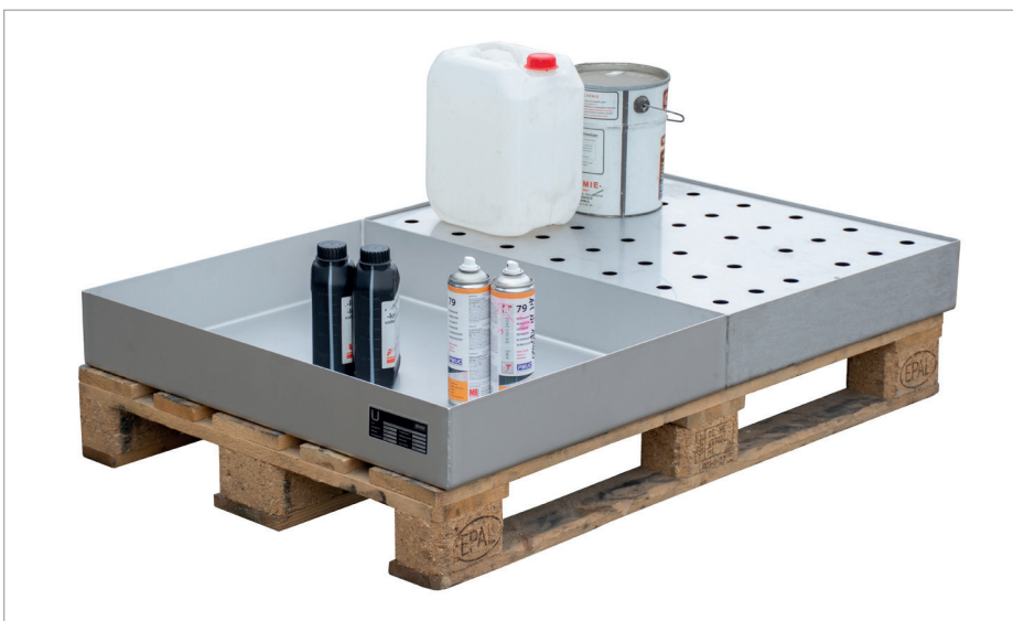
Op europallet 1200x800 mm: KGW-P 2 V4A en KGW-P 2/M V4A