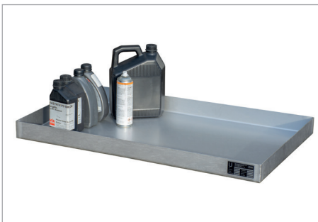
KGW 3 V4A