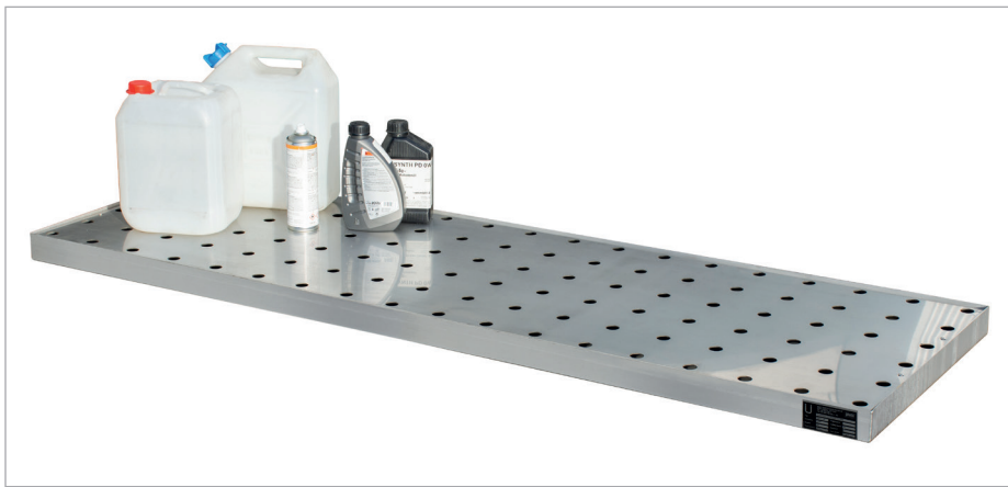
KGW 5/M V4A