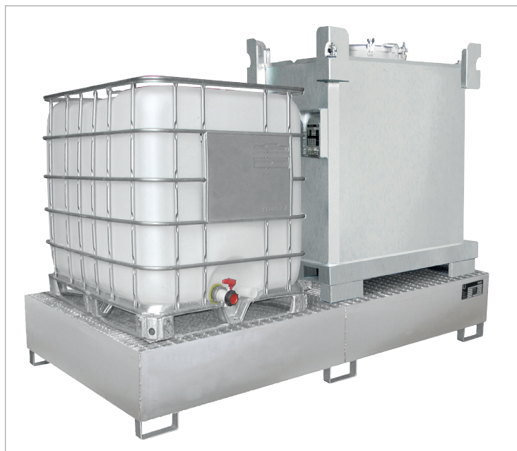
VAW-1000-2 mit Gitterrost (Zubehör)