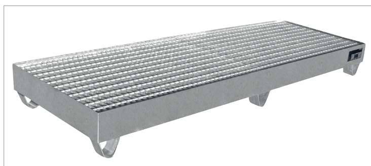
VAW-4/B mit Gitterrost (Zubehör)