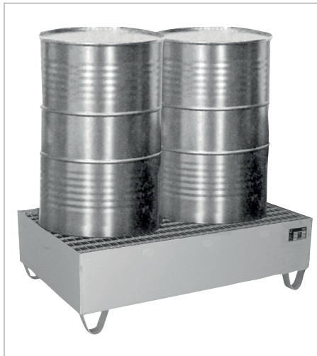
VAW-2 met rooster (optie)

Opslag van max. 4 vaten à 200 liter of max. 2 containers (IBC) à 1000 liter met agressieve stoffen, ook met 60 liter vaten en kleine verpakkingen combineerbaar