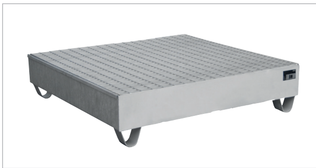
VAW-4/A met rooster (optie)