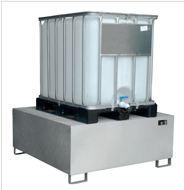
VAW-1000 met rooster (optie)