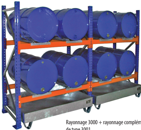
Rayonnage 3000 + rayonnage complémentaire de type 3001