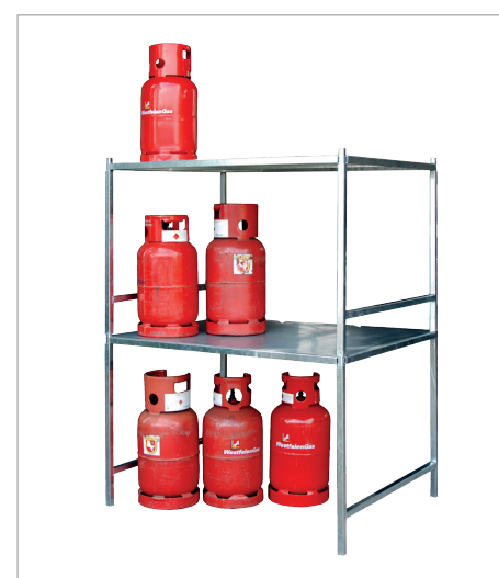
2x GFG, gestapeld