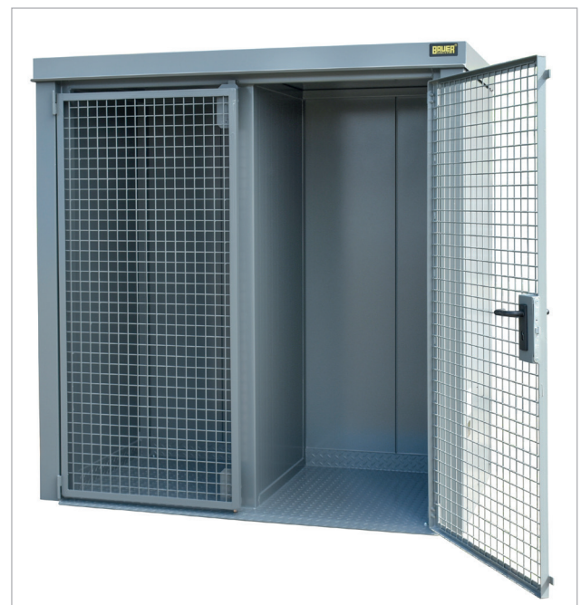
GFC-B met vuurbestendige scheidingswand