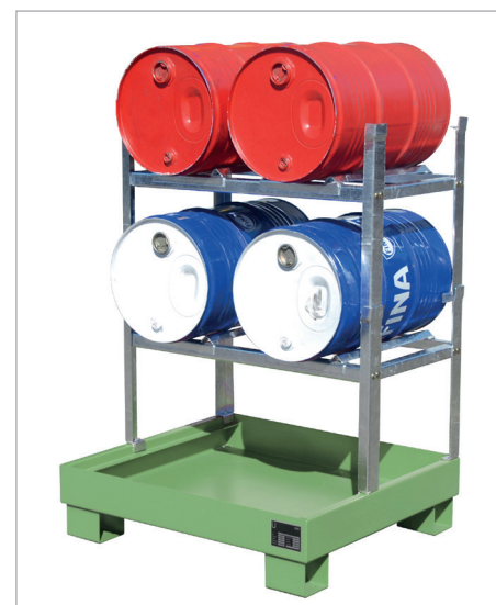
AW 60-2 + 2xAG 60-2 + 4xFA 60-A