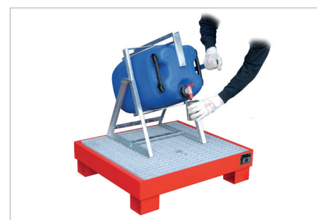
Jerrycan schenkhulp KAH 60 met opvangbak AW 60-2/M