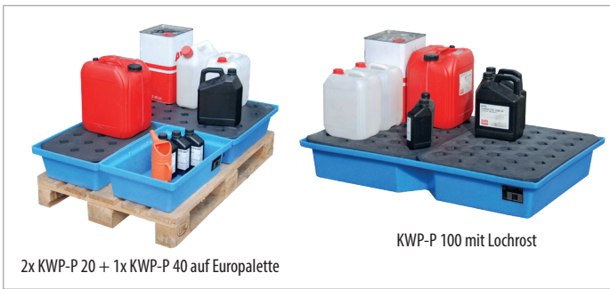
2x KWP-P 20 + 1x KWP-P 40 auf Europalette