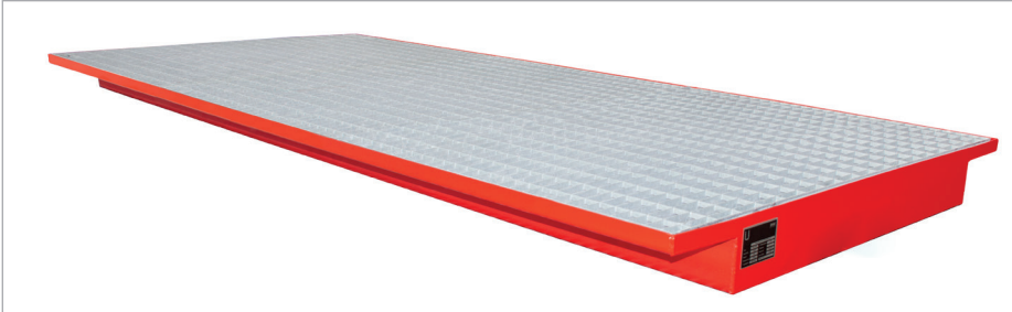
Hangopvangbak EHW 2700