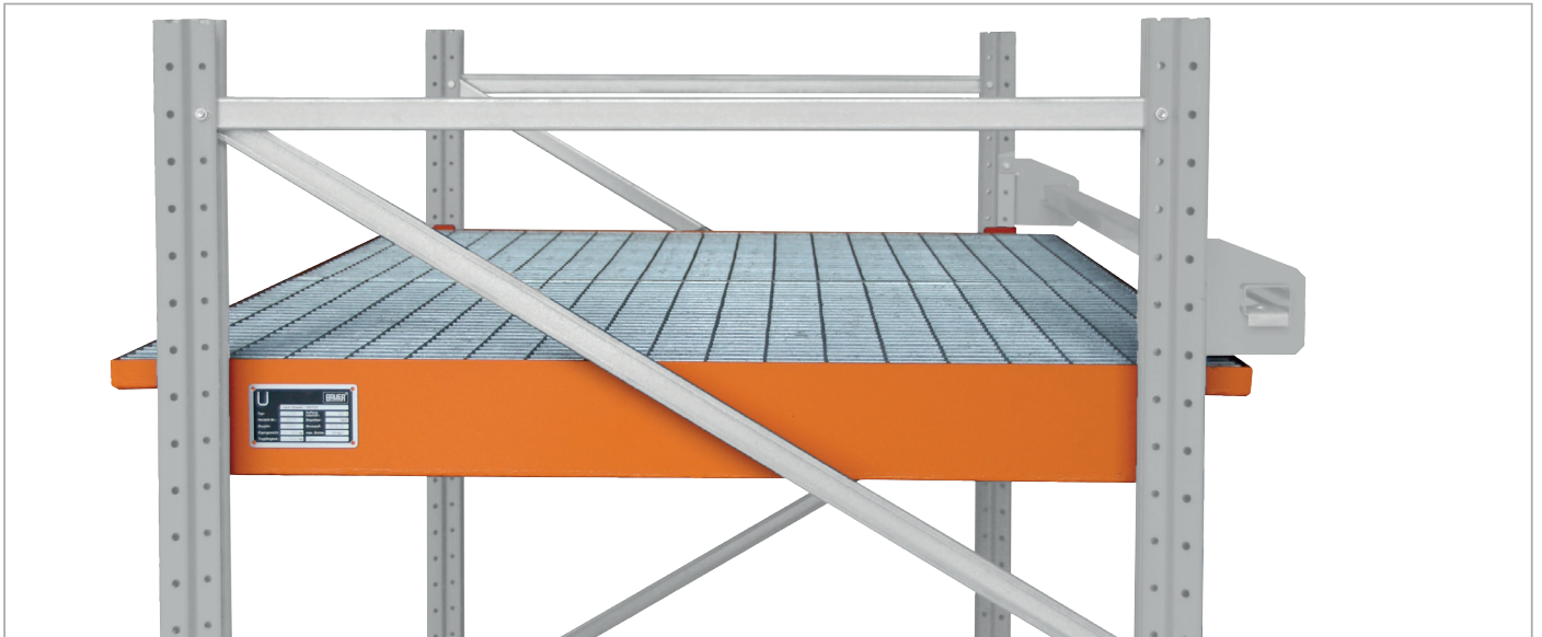
Hangopvangbak EHW 1800