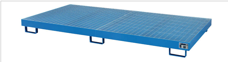
Regalwanne RW-GR 2700-1