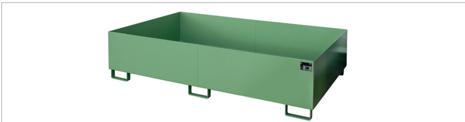
Regalwanne RW 2200-2