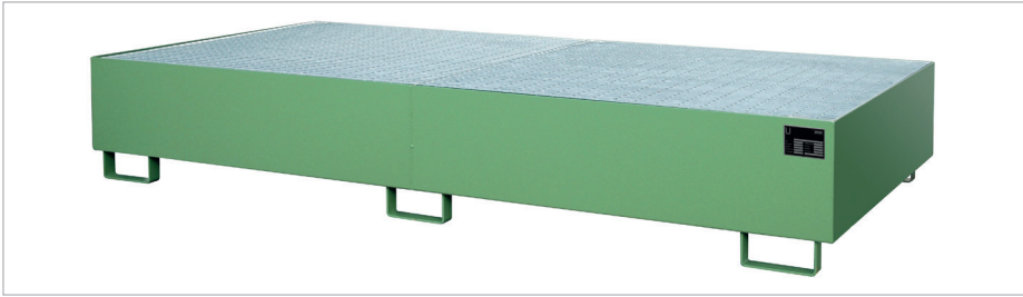
Regalwanne RW-GR 2700-3