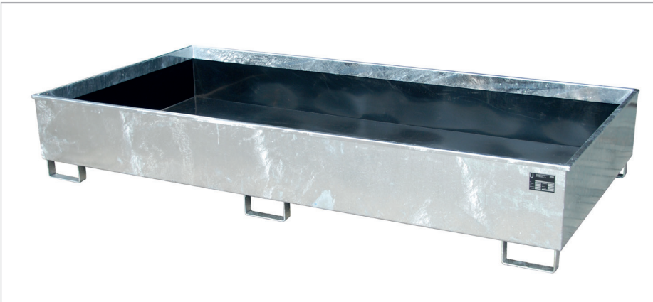
RW 2700-3 PE