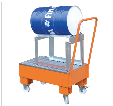
AW 60-1 SRF