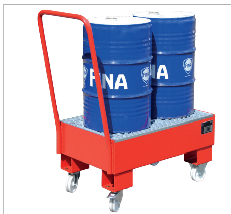
AW 60-1 SR