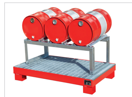
AW 60-3/M avec support de fûts FA 60-3 (voir page 116)