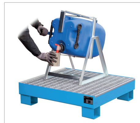
AW 60-2/M avec aide au remplissage KAH-60 (voir page 116)