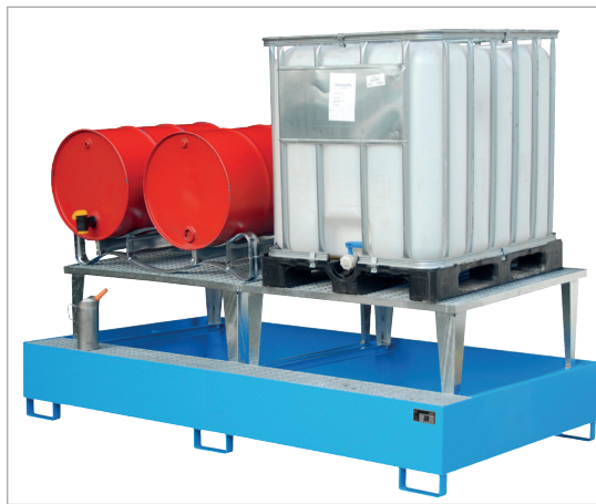
AWA 1000-2 + FP-2

Maniement sûr lors du remplissage ou lors du nettoyage d'objets huileux. Stockage d'un max. de 3 conteneurs (IBC) de 1000 litres, également combinable avec des fûts de 200 litres et de 60 litres ou de petits récipients