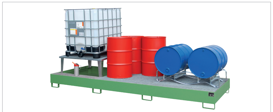
AWA 31 + FP-2