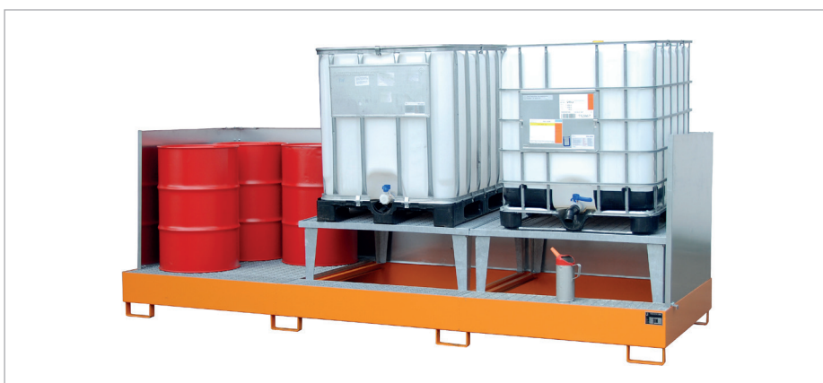
AWA 32/SW (met spatbeschermwand)