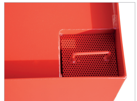
Ouverture d'aspiration et indicateur de niveau