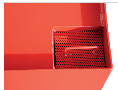
Afzuigopening en indicatie van het vulniveau