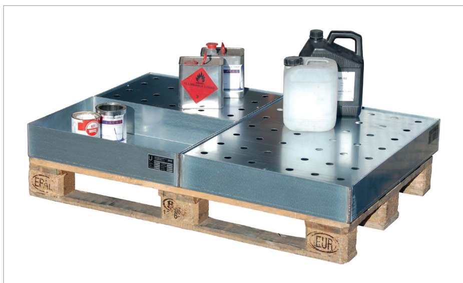
Auf Europalette 1200x800 mm: KGW-P 1, KGW-P 1 mit Lochblech-Rost und KGW-P 2 mit Lochblech-Rost