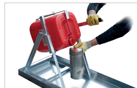
KGW 2 mit Kanister-Abfüllhilfe KAH-25.