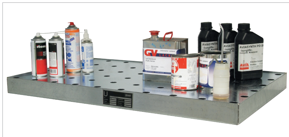
KGW mit Lochblech-Rost