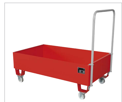
Auffangwanne mit Modul 2