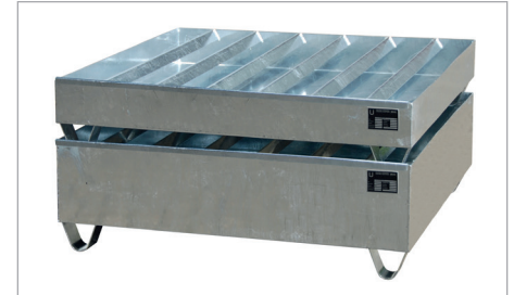
PWE 200-4 en 400-4 stapelbaar