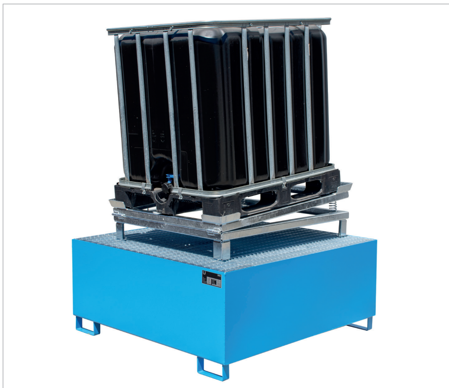
IR-1 op een 1000-l-opvangbak